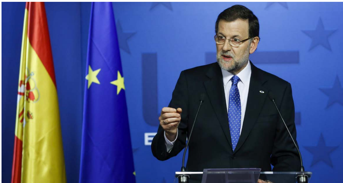
El presidente del Gobierno, Mariano Rajoy, durante la rueda de prensa posterior al Consejo Europeo celebrado en Bruselas. Viernes, 8 de febrero de 2013.